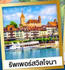
ริวีเยอร์สวิลोजना