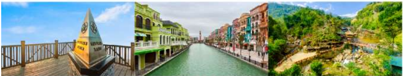
ยอดเขาฟ่านซีบิ่น