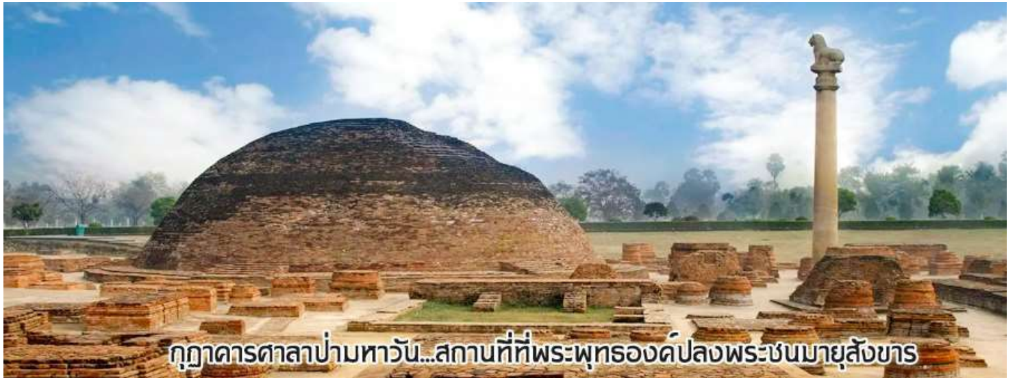
กุฎาคารศาลาป่ามหารวัน...สถานที่ที่พระพุทธองค์ปลงพระชนมายุสังขาร

นำท่านเดินทางต่อสู่เมือง กุสินารา (เดินทางประมาณ 4 ชั่วโมง)เมื่อถึงกุสินาราแล้วเดินทางไป วัดไทยกุสินาราเฉลิมราชย์ วัดนี้สร้างขึ้นเพื่อน้อมเป็นพุทธบูชาและเฉลิมพระเกียรติพระบาทสมเด็จพระเจ้าอยู่หัวในวาระครองสิริราชสมบัติครบ 50 ปี และเฉลิมพระชนมพรรษาครบ 6 รอบ 72 พรรษา พระบาทสมเด็จพระเจ้าอยู่หัวพระราชทานชื่อวัดให้ เชิญท่านร่วมทำบุญตามกำลังศรัทธา