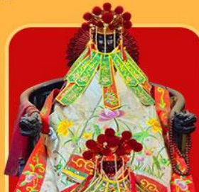
เจ้าแม่กวนอิมสองอำ