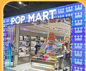
ช้อปปิ้ง POP MART