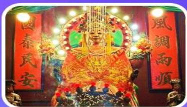
วัดเจ้าแม่กวนอิมเทียนหัว