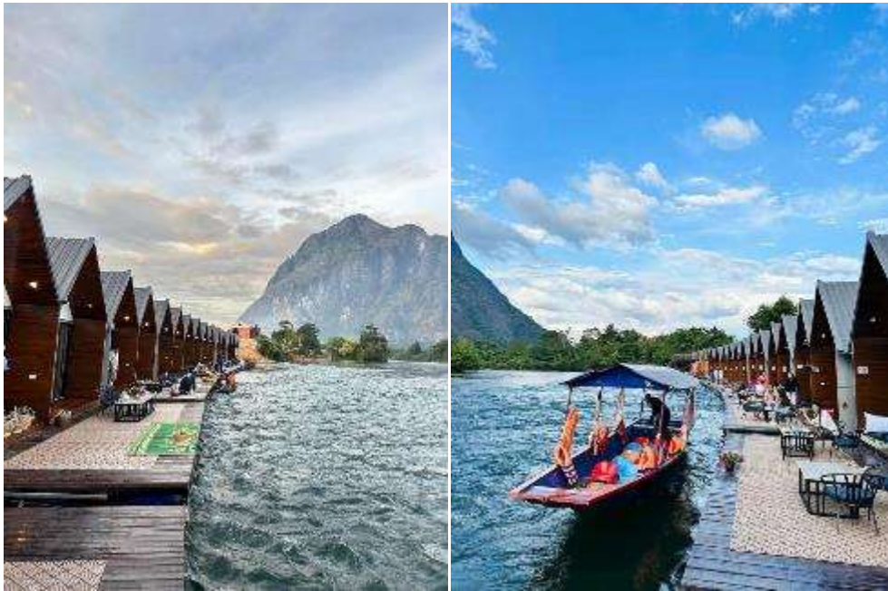
พักที่ แพริเวอร์ไซด์ 2 หรือเทียบเท่า