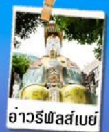
อ่าวรีฟัสเสย์