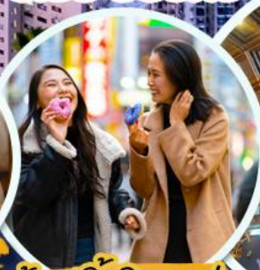
ช้อปปิ้งจิมซาจุ่ย