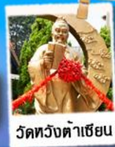
วัดทวงต้าเซียน