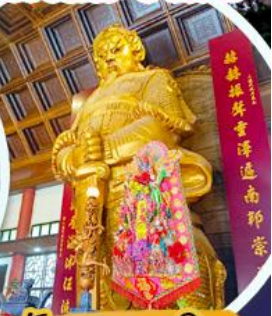
วัดแควงฉมิว

สายการบิน GREATER BAY AIRLINE ( ชั้นเครื่องสุวรรณภูมิ )