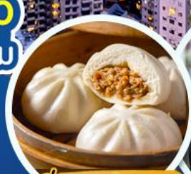
ติ่มซำฮ่องกง