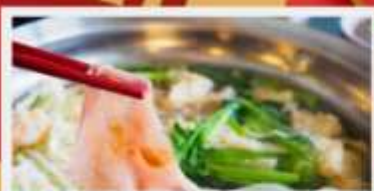
พิเศษ! ชาบูฮ่องกง