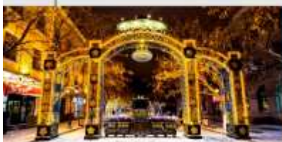
ถนนคนเดินจงหยาง