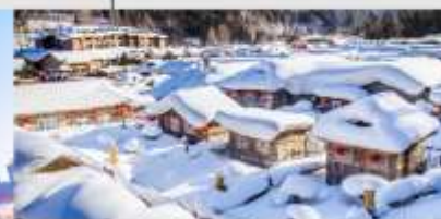
หมู่บ้านหิมะ

*ทางบริษัทฯ ขอสงวนสิทธิ์ในการสลับโปรแกรมทัวร์ตามความเหมาะสมขึ้นอยู่กับสถานการณ์หน้างาน โดยคำนึงถึงผลประโยชน์ของลูกค้าเป็นสำคัญ