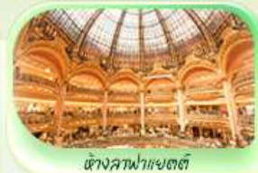
ห้างคาฟฟาแยตต์