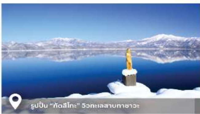
รูปปั้น "กัตสึโทะ" วิวทะเลสาบคาซาเวะ

2/188 ม.พฤษจันทร์ อ.เพิ่มสิน ซอย 34 แขวงคลองถนน เขตสายไหม กทม 10220