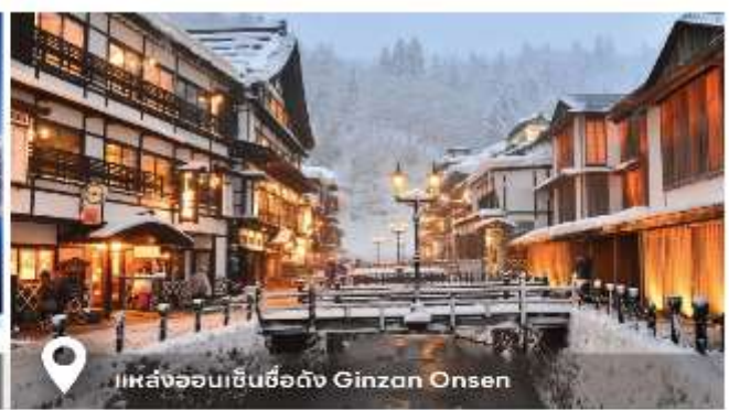
แหล่งออนเซ็นชื่อดัง Ginza Onsen