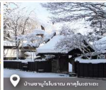
บ้านชาบูโรโบราณ คาคุโนะดาเตะ