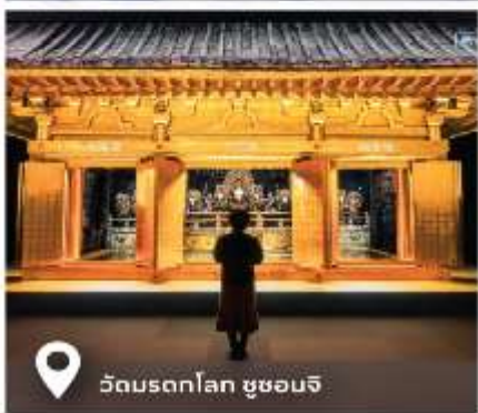
วัดมรดกโลก ชูซอนจิ