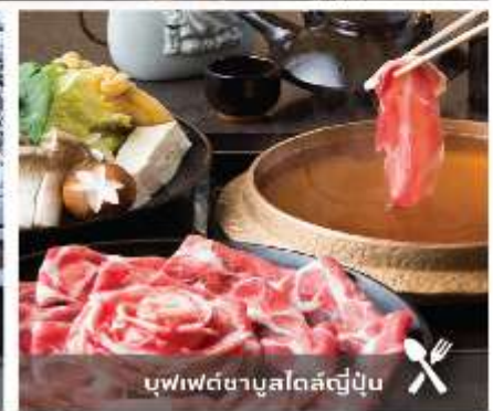
บุฟเฟ่ต์ชาบูสโกล์ญี่ปุ่น