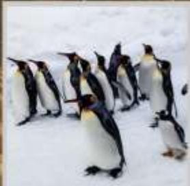
"PENGUIN ASAHIYAMA ZOO"