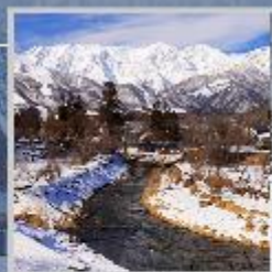
"HAKUBA OIDE PARK"