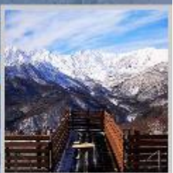
"HAKUBA MOUNTAIN HARBOR"