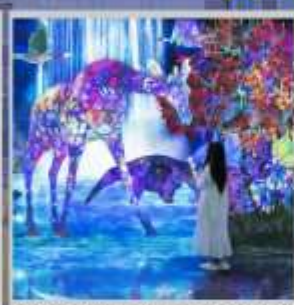
“TEAM LAB FOREST”