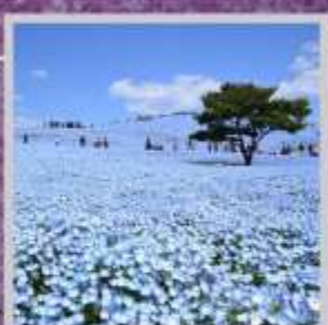
"HITACHI SEASIDE PARK"