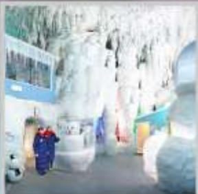
"KAMIKAWA ICE PAVILLION"