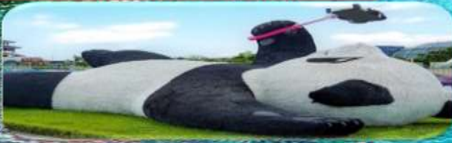
แพนด้าเซลฟี