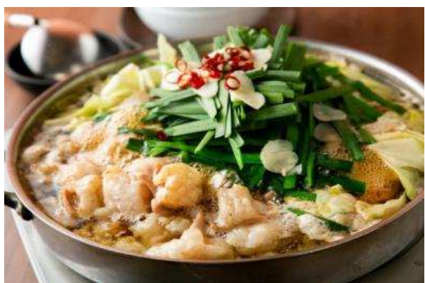
มตสึนาเบะ (Motsunabe)