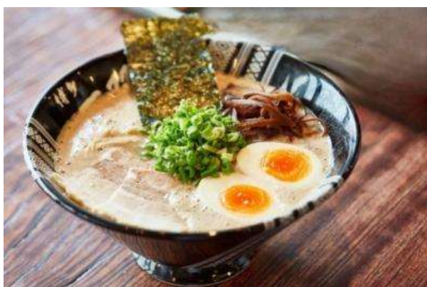
ฮากาตะราเมง (Hakata Ramen)