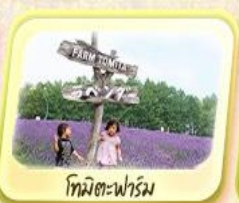
โทมัตะฟาร์ม