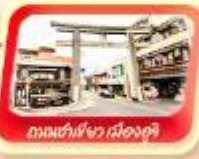
ถนนซันโจว เมืองอูจิ