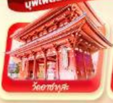
วัดฮามะมิตะ

11-16 มิ.ย.68 / 9-14 ก.ค.68 / 25-30 ก.ค.68 / 8-13 ส.ค.68 29 ส.ค.-3 ก.ย.68 / 17-22 ก.ย.68 / 24-29 ก.ย.68