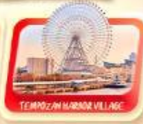
TEMPOZAN HARBOR VILLAGE