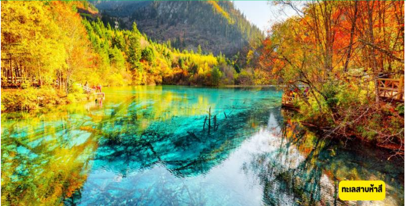
ทะเลสาบห้าสี