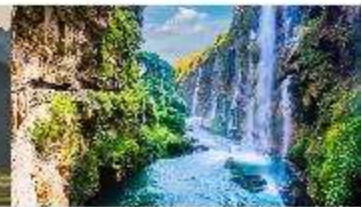
ชุมชนน้ำตกร้อยสายหม่าหลิงเหอ

*ทางบริษัทฯ ขอสงวนสิทธิ์ในการสลับโปรแกรมทัวร์ตามความเหมาะสมขึ้นอยู่กับสถานการณ์หน้างาน โดยคำนึงถึงผลประโยชน์ของลูกค้าเป็นสำคัญ