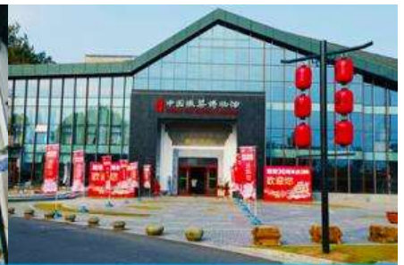
พิพิธภัณฑ์อาหารพื้นเมืองหูโจว