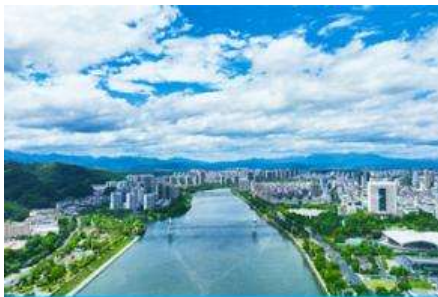
เมืองหวงซาน

พักที่ WIENNA HOTEL OR XIN AN YAN HOTEL ระดับ 4 ดาวท้องถิ่นหรือเทียบเท่าในเมืองหวงซาน