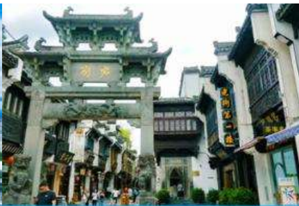
ถนนโบราณถนนซีหล่าเจีย