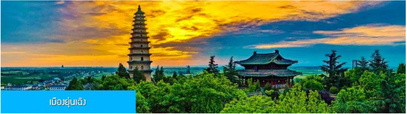
เมืองยูนเฉิง