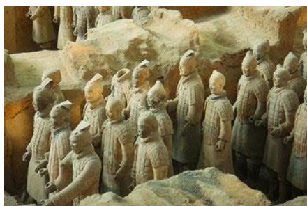
สุสานกองทัพทหารม้าจินซี

พักที่ XINYUAN HOTEL 4* หรือ โรงแรมในระดับเดียวกัน เมืองหัวซาน