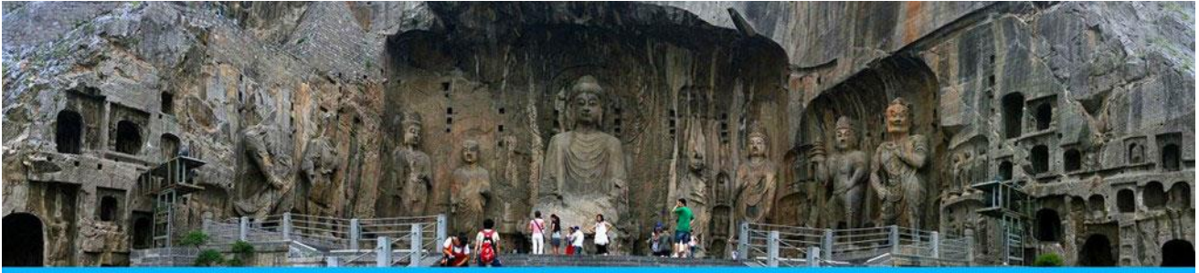
ถ้ำหินหลงเหมิน