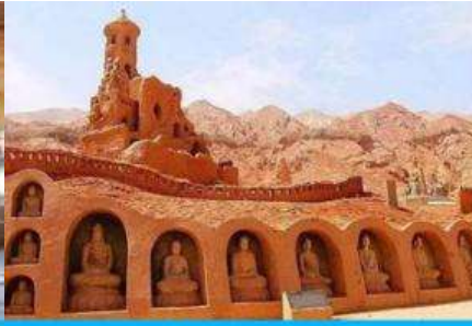
ถ้ำพระพันองค์