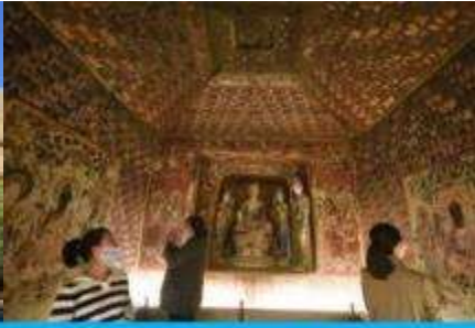
ชมภาพยนตร์ 3 มิติ