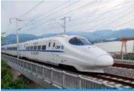
นิ้งรถไฟความเร็วสูง