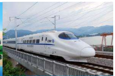
ตู้รถไฟความเร็วสูง