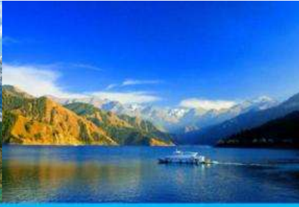
ล่องเรือทะเลสาบเทียนฉือ