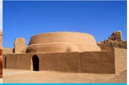
เมืองโบราณเกาซางกุ่เจิง