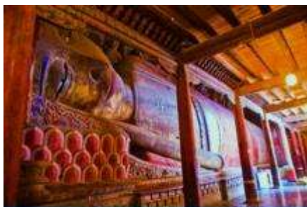
วัดพระใหญ่

พักที่ SI LU QIAN XI HOTEL โรงแรมระดับ 4 ดาวท้องถิ่น หรือเทียบเท่าในเมืองจางเยี่ย