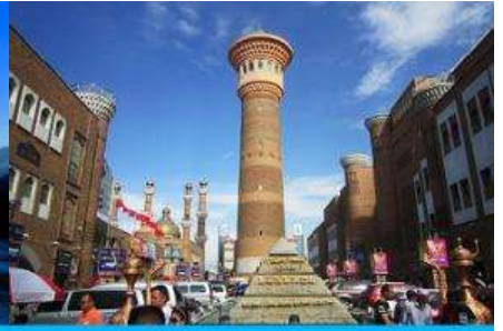
ตลาดต้าปาจา