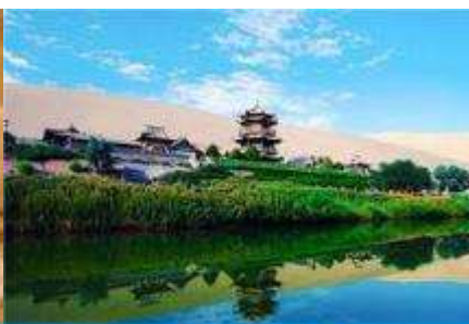
สระบัววพระจันทร์