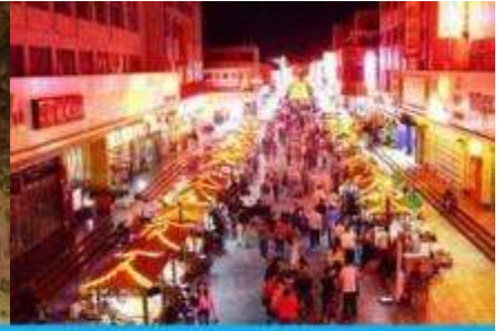
ตลาดกลางคืน ซาโจว

วันที่สี่ ด่านเจียหยวีกวน – เดินทางสู่เมืองตุนหวง – เที่ยวชมถ้ำมั่วเกาถู – ชมภาพยนตร์ 3 มิติ-ซาโจวไนท์มาร์เก็ต