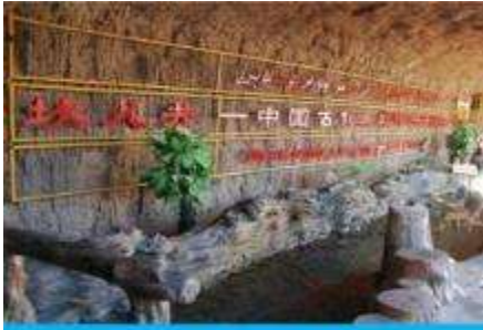
ระบบชลประทานคู่หลูฟาน