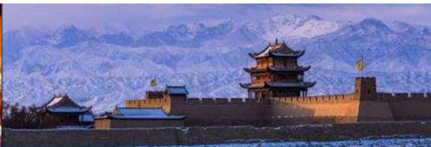
ด่านเจี๋ยวิ้วกวน

วันที่สาม เมืองจางเยี่ย – วัดพระใหญ่เมืองจางเยี่ย –เดินทางสู่เมืองเจี๋ยวิ้วกวน-ด่านเจี๋ยวิ้วกวน