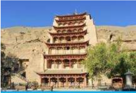
ถ้ำหินมั่วเกาถู