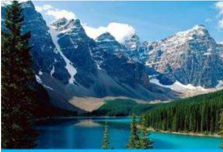
ภูเขาเทียนชาน