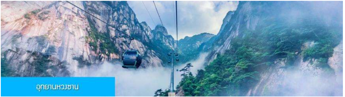
อุทยานหวงซาน

หรือท่านสามารถเลือกซื้อโปรแกรมเสริม เที่ยวชมอุทยานหวงซานแบบครึ่งวันพร้อมอาหารกลางวัน โดยมีอัตราค่าบริการท่านละ 650 หยวนหรือเท่ากับเงินไทย 3,250 บาท อัตราค่าบริการรวมค่ารถรับส่งไปยังอุทยาน ค่ากระเช้าขึ้น/ลงเขาหวงซาน ค่าอาหารกลางวัน มูลค่า 50 หยวน ค่านำเที่ยวอุทยานของไกด์ท้องถิ่น โดยใช้เวลาเที่ยวชมอุทยานประมาณ 6 ชั่วโมง(รวมเวลานั่งรถเข้า ออกอุทยานและทานอาหารมื้อกลางวัน) ( ในกรณีที่สภาพอากาศไม่เอื้อต่อการเที่ยวชม เช่น มีฝนตก หรือมีหมอกหนาจนบดบังทัศนวิสัย ทางทัวร์จะไม่แนะนำให้ท่านเลือกซื้อโปรแกรมท่องเที่ยวภูเขาหวงซาน)