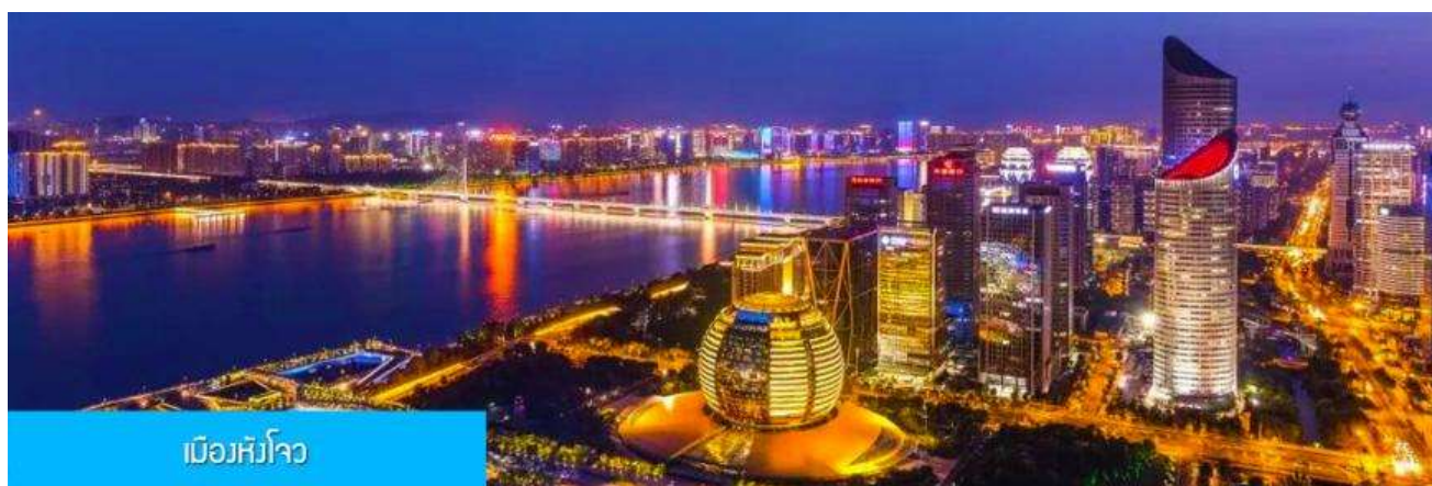
เมืองหังโจว