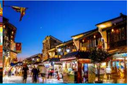
ย่านเหอฝางเจีย

วันที่ห้า เมืองหวงซาน – เมืองหังโจว – ล่องเรือชมทะเลสาบซีหู – ถนนโบราณเหอฝางเจีย-เดินทางไปสนามบิน