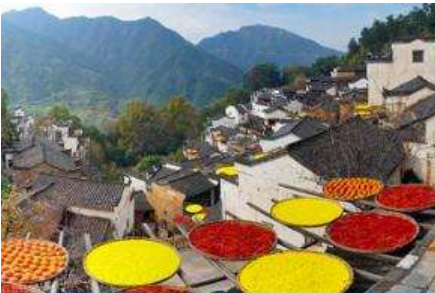
หมู่บ้านโบราณหวงหลิว

พักที่ โรงแรม JIANGNAN HAOTING HOTEL ระดับ 4 ดาวท้องถิ่นหรือเทียบเท่าในเมืองชั่งเหรา