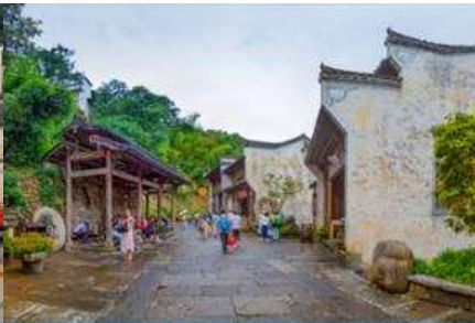
ถนนโบราณเกียนเจีย