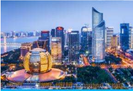
เมืองหังโจว