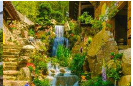
ถนนรดดอกไม้