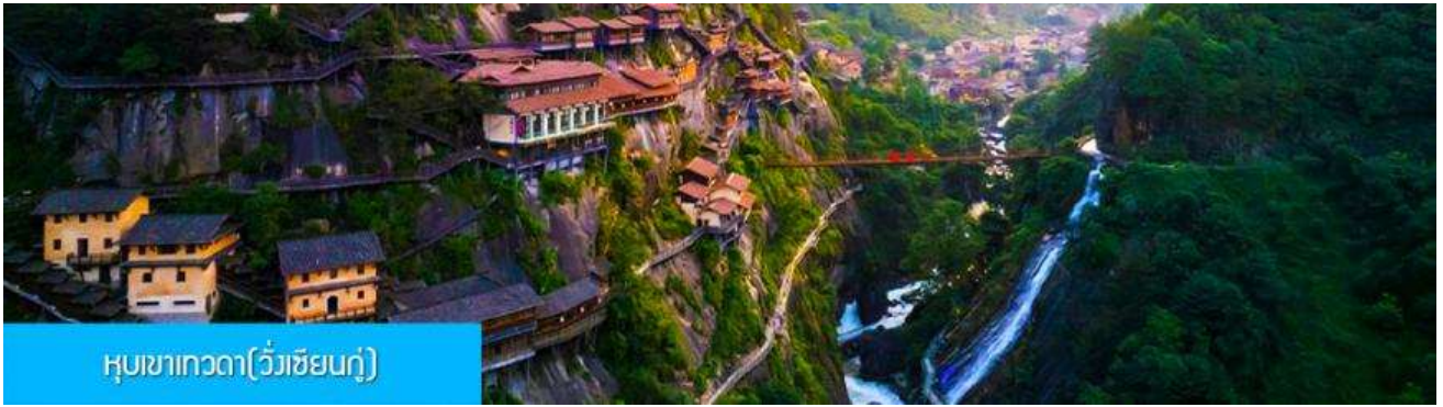
หุบเขาเทวดา(วังเซียนกู่)