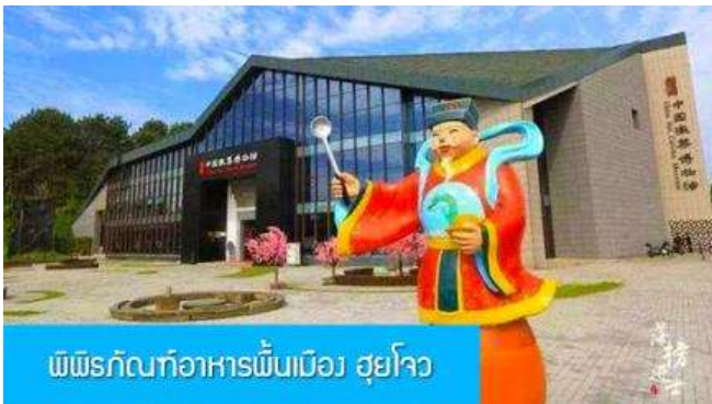
พิพิธภัณฑ์อาหารพื้นเมือง ฮุยโจว

หรือท่านสามารถเลือกซื้อโปรแกรมเสริม เที่ยวชมอุทยานหวงซานแบบครึ่งวันพร้อมอาหารกลางวัน โดยมีอัตราค่าบริการท่านละ 650 หยวนหรือเท่ากับเงินไทย 3,250 บาท อัตราค่าบริการรวมค่ารถรับส่งไปยังอุทยาน ค่ากระเช้าขึ้น/ลงเขาหวงซาน ค่าอาหารกลางวัน มูลค่า 50 หยวน ค่านำเที่ยวอุทยานของไกด์ท้องถิ่น โดยใช้เวลาเที่ยวชมอุทยานประมาณ 6 ชั่วโมง(รวมเวลานั่งรถเข้า ออกอุทยานและทานอาหารมื้อกลางวัน) ( ในกรณีที่สภาพอากาศไม่เอื้อต่อการเที่ยวชม เช่น มีฝนตก หรือมีหมอกหนาจนบดบังทัศนวิสัย ทางทัวร์จะไม่แนะนำให้ท่านเลือกซื้อโปรแกรมท่องเที่ยวภูเขาหวงซาน)