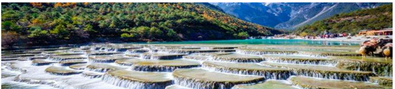
หุบเขาพระจันทร์สีน้ำเงิน Blue Moon Valley

หมายเหตุ กรณีที่กระเซ็นใหญ่ขึ้นภูเขาหิมะมังกรหยกปิดให้บริการ ด้วยเหตุที่สภาพอากาศไม่เอื้ออำนวย หรือเป็นการปิดเพื่อตรวจสอบสภาพและซ่อมแซมประจำปี ทางทัวร์ขอสงวนสิทธิ์ที่จะจัดโปรแกรมขึ้นกระเซ็น ที่จุดชมวิภูเขาหิมะมังกรหยก ณ สถานีกระเซ็นหุบเขาผิง แทน