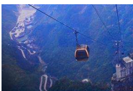
กระเช้าขึ้นเขายเทียนเหมินซาน

https://hk.trip.com/hotels/guzhang-hotel-detail-68614854/chaxitai-holiday-hotel/