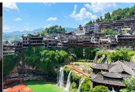
เมืองโบราณผู่หรงเจี้ยน