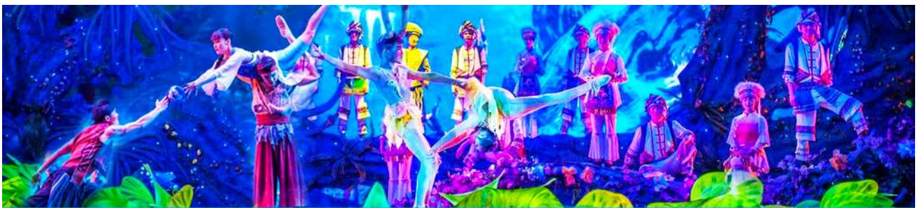
โชว์ The Charming Xiangxi

หลังอาหารนำท่านเดินทางเข้าที่พัก หรือท่านสามารถเลือกซื้อโปรแกรมเสริม เป็นบัตรชมการแสดง ชุด The Charming Xiangxi หรือที่เรียกกันในหมู่นักท่องเที่ยวไทยว่า โชว์เมย์ลี่เซียงซี เป็นการแสดงในโรงละครขนาดใหญ่ที่จุผู้ชมได้กว่า 3100 คน/รอบ ใช้ทุนสร้างกว่า 2,300 ล้านบาท เป็นหนึ่งในการแสดงที่น่าดูชมที่สุดในเมืองจางเจียเจี๋ย แต่ละฉากการแสดงมีการออกแบบเวที ฉากประกอบที่พิถีพิถัน ประณีต และอลังการ ใช้ทีมงานนักแสดงหลายร้อยคน และระบบแสง สี เสียงที่ทันสมัยประกอบในการแสดง