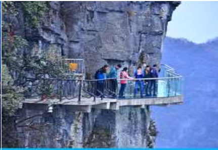
หน้าพลาวยฟ้าทางเดินกระจก