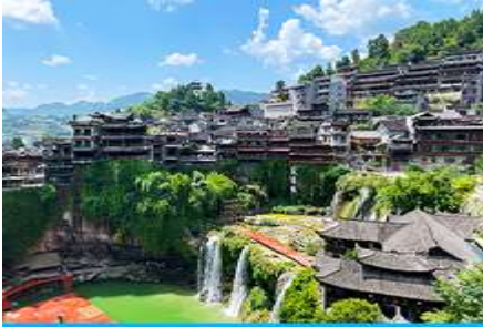
เมืองโบราณฝูหรงจิ้น