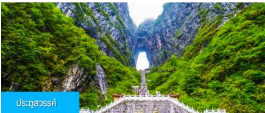
ประจูดสวรรค์