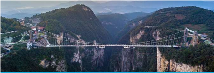
สะพานกระจกาวเจียเจีย