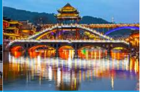
สะพานหงเจียว