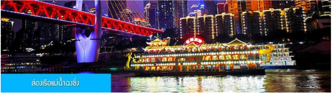
ล่องเรือแม่น้ำฉงชิ่ง

OPTIONAL TOUR ไกด์ขายล่องเรือแม่น้ำฉงชิ่ง ชมความสวยงามของสองริมฝั่งแม่น้ำเมืองฉงชิ่ง ล่องเรือ ท่านละ 280 หยวน หรือประมาณ 1,400 บาท