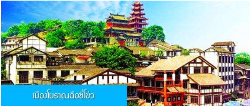
เมืองโบราณฉือชิว

พักที่ BORRMAN HOTEL โรงแรมระดับ 4 ดาวหรือเทียบเท่าในเมืองจงชิ่ง