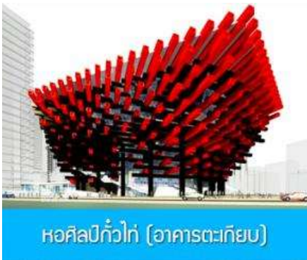
หอศิลป์แก้วโก๋ (อาคารตะเกียบ)