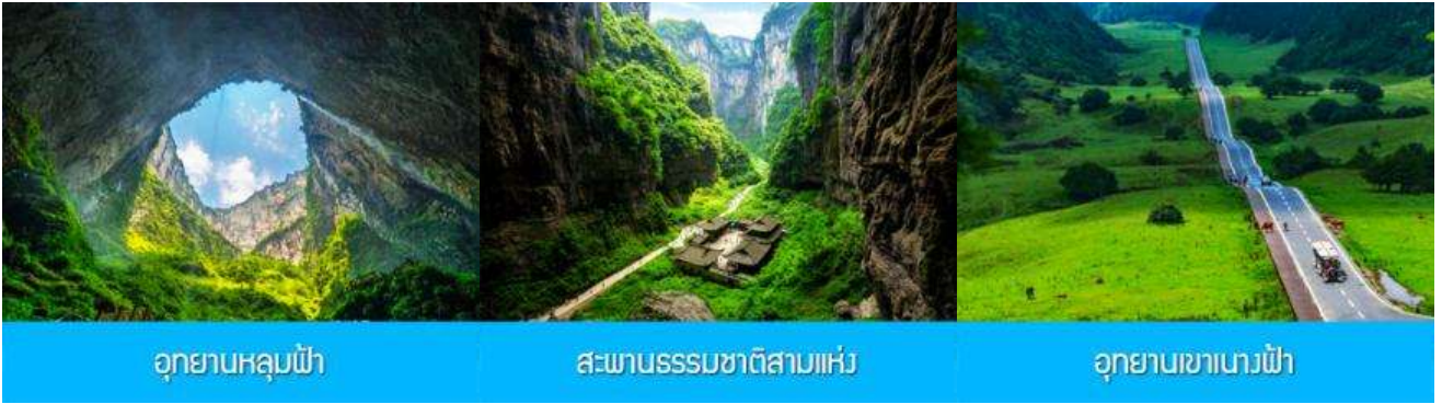
อุทยานหลุมฟ้า