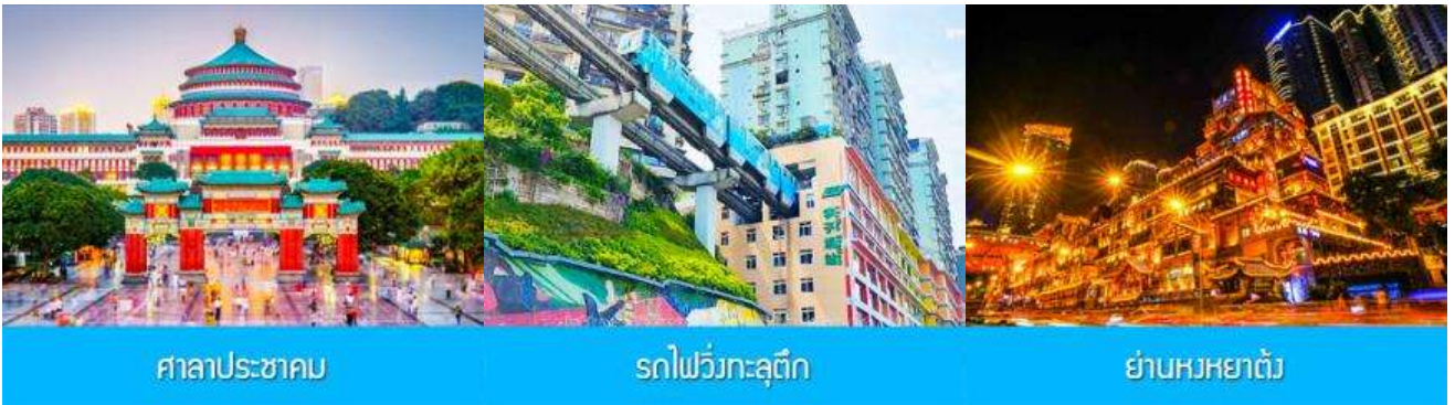
ศาลาประชาชน

ค่ำ รับประทานอาหารค่ำ ณ ภัตตาคาร พักที่ DAWEI YING HOTEL โรงแรมระดับ 4 ดาวหรือเทียบเท่าในเมืองอู่หลง