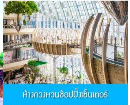
ห้างกวงหวนช้อปปิ้งเซ็นเตอร์

วันที่ห้า เมืองจงชิ่ง-เมืองโบราณฉือชิว-กวงหวนช้อปปิ้งคอมเพล็กซ์ –บินกลับกรุงเทพ (ดอนเมือง)