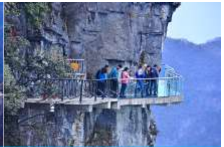
หน้าผาลอยฟ้าทางเดินกระจก