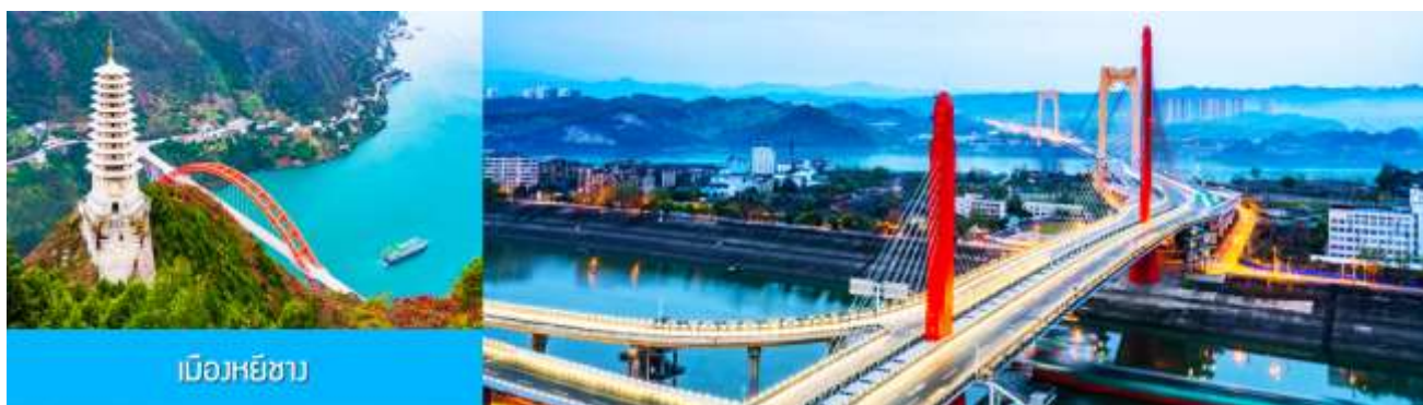
เมืองหยีซาง

ชมลพที่แก้วไปหลง 2. โข่วจิ้งจอกขาว โปรอ่านรายละเอียดในโปรแกรม