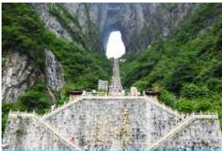
ประตูสวรรค์