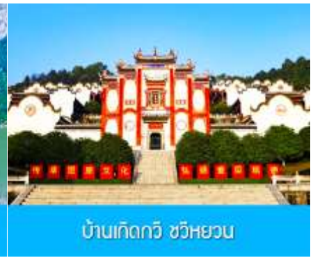
บ้านเกิดกวี ขวี่หยวน