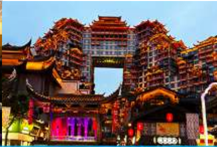
ตึกมหัศจรรย์ 72 ชั้น