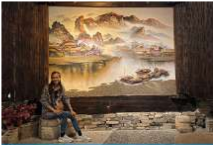
พิพิธภัณฑ์ภาพเขียนหินทราย

พักที่ ZHENMIAN HOTEL OR YINXIANG HOTEL ระดับ 4 ดาวท้องถิ่นหรือเทียบเท่าในเมืองจางเจียเจีย