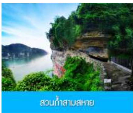
สวนถ้ำสามสหาย