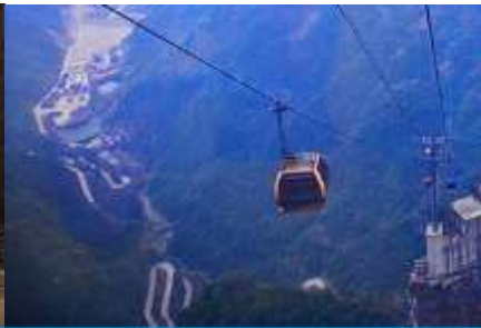
กระเช้าขึ้นเขาเทียนเหมินซาน