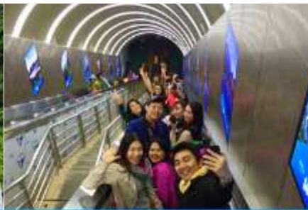
บันไดเลื่อนทะลุภูเขา