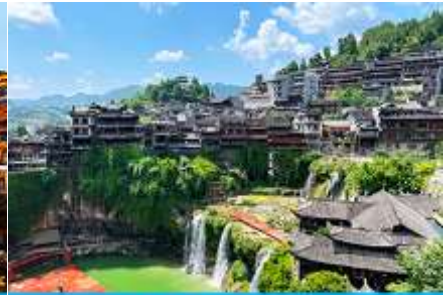
เมืองโบราณฝูหรงเจิ้น