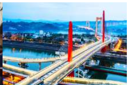
เมืองหยีซา