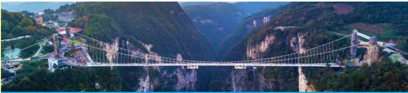
สะพานกระจกข้ามหุบเขาแกรนด์แคนยอน

โปรแกรมเสริมที่ 3 โปรแกรมเที่ยวชมสะพานกระจกพร้อมหุบเขาแกรนด์แคนยอนจากเจียเจีย (ผู้เข้าร่วมขั้นต่ำ 15 ท่าน) ใช้เวลาประมาณ 2-3 ชั่วโมง (ขึ้นอยู่กับจำนวนนักท่องเที่ยวในแต่ละวัน) อัตราค่าบริการท่านละ 400 หยวนหรือ 2,000 บาท นำท่านเที่ยวชมสะพานกระจกที่สร้างล้อมหุบเขาที่ยาวที่สุดในโลก ทำความกล้าของท่านด้วยการเดินบนพื้นกระจกใสที่สามารถมองเห็นก้นเหวลึกที่อยู่เบื้องล่าง....อัตราค่าบริการรวม ค่าบัตรเข้าอุทยาน ค่ารถรับส่งภายในเขตอุทยาน ค่าน้ำดื่มของไกด์ท้องถิ่น