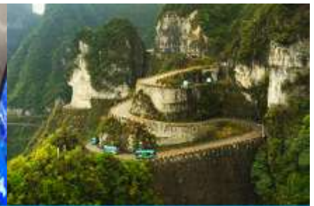
เส้นทาง 99 โค้ง