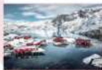
หมู่บ้าน Nusfjord

** พักที่ ELIASSEN RORBUER OR SIMILAR **