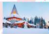
หมู่บ้านซานต้าครอส

15.25 น. ออกเดินทางสู่อิสตันบูล ประเทศตุรกี เที่ยวบินที่ TK 1750 21.10 น. เดินทางถึงสนามบินอิสตันบูล (แวะเปลี่ยนเครื่อง)