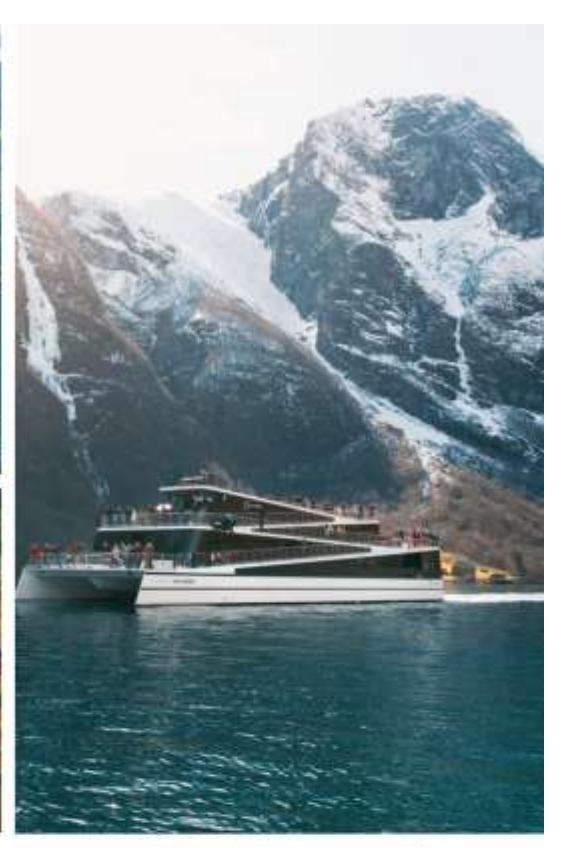
วันที่ 4 เบอร์เก้น – กู๊ดวาเก้น – ล่องเรือมรดกโลก เนรอยฟยอร์ด – รถไฟสายโรแมนติก ฟลอม