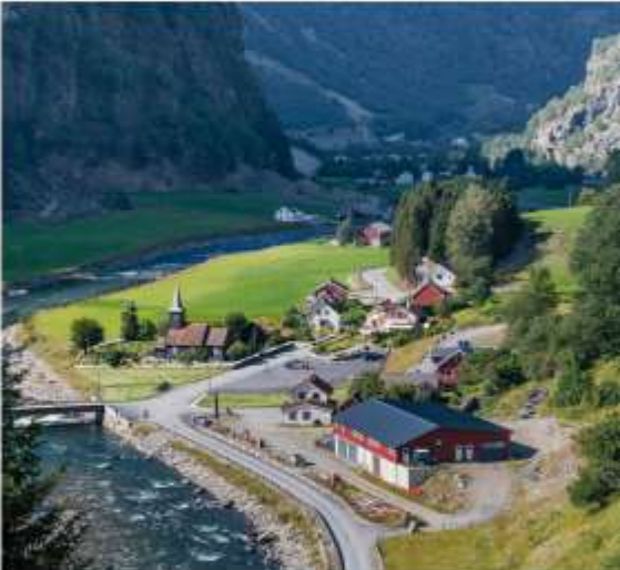
วันที่ 5 ฟลอม – ธารน้ำแข็ง บริกสเดล – โทรลคาร์ – สตรีน – ไกแรงเกอร์ -จุดชมวิวตาลสนิบบา