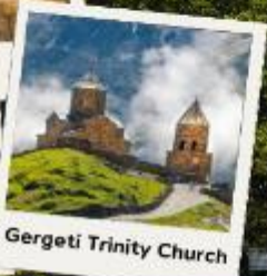
Gergeti Trinity Church