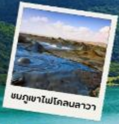
ชมภูเขาไฟโคลนลาวา