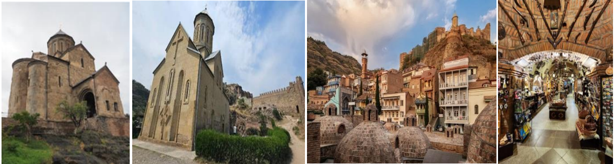
นำท่านเข้าสู่ที่พัก Iveria Inn Hotel หรือเทียบเท่า ★★★★★

วันที่ห้า เมืองทบิลีซี – วิหารจวารี – ป้อมอนานูรี – เมือง Pasaunauri – เมือง Stepansminda – โบสถ์เกอร์เกดี Russian-Georgian Friendship Monument – เมืองคูตาอูรี