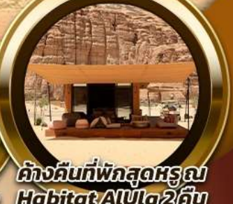
คันทันที่พักผ่อนสุดหรู Habitat AlUla 2 คืน

พิเศษ!! รับประทานอาหาร ณ ภัตตาคารอาหารไทย สุดหรูและไฮโซ @Saffron Banyan Tree AlUla