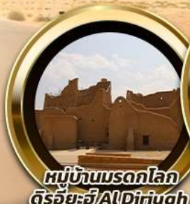
หมู่บ้านมรดกโลก ดีริยาห์ AlDiriyah

บินหรู อยู่สบาย เที่ยวบินดี ซิลด์ ซิลด์ 10 ท่าน คอนเฟิร์มเดินทาง