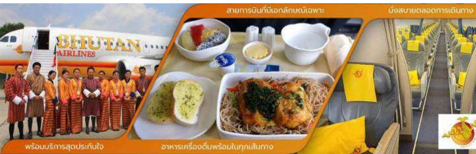
พร้อมบริการสุดประทับใจ