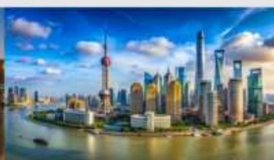
หาดไว่ถาน

*ทางบริษัทฯ ขอสงวนสิทธิ์ในการสลับโปรแกรมทัวร์ตามความเหมาะสมขึ้นอยู่กับสถานการณ์หน่วยงาน โดยคำนึงถึงผลประโยชน์ของลูกค้าเป็นสำคัญ