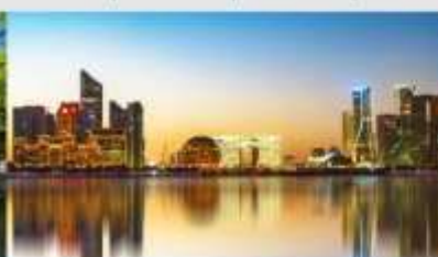
QIANJIANG NEW CITY