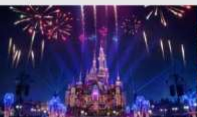
เซี่ยงไฮ้ดิสนีย์แลนด์