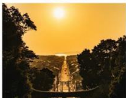
ศาลเจ้ามิยาจิดากะ Miyajidake Shrine

จากนั้นนำท่านเดินทางกลับสู่ เมืองฟุกุโอกะ เมืองใหญ่อันดับ 6 ของญี่ปุ่น และเป็นเมืองที่ได้รับการจัดอันดับว่าเป็นเมืองน่าอยู่อันดับที่ 12 ของโลก