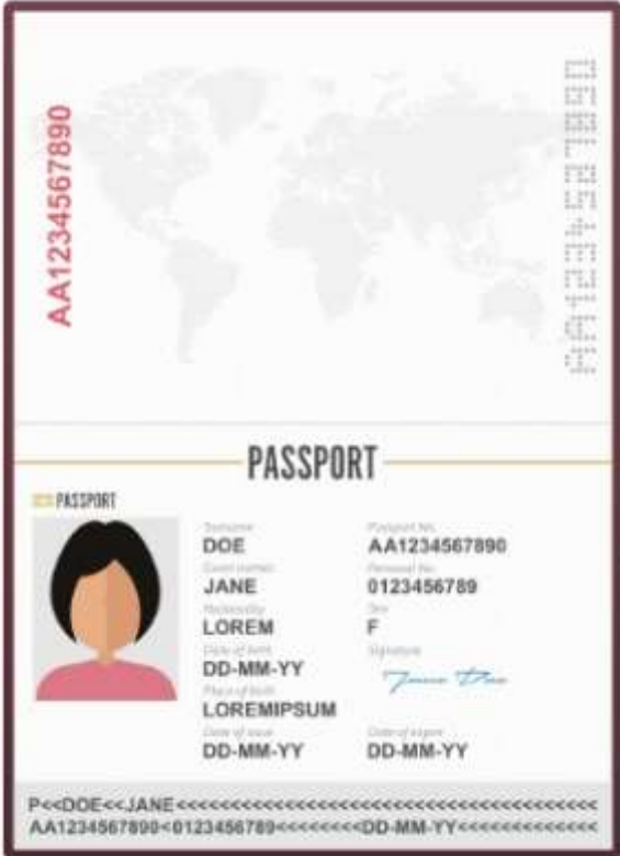
รูปถ่ายหน้าพาสปอร์ต