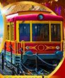
รถรางซาปา