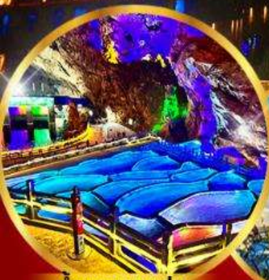
ถ้ำนงกวางแอน