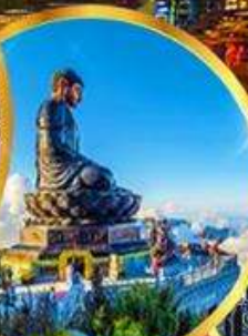
ฟานซีปัน