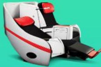
พรีเมียมฟลัดเบด