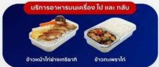
บริการอาหารบนเครื่อง ไป และ กลับ