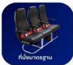
ที่นั่งมาตรฐาน