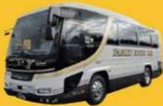
Bus (10-20 ท่าน)

➔ สำหรับท่านที่ต้องการความเป็นส่วนตัวมากขึ้น ท่านสามารถเลือกใช้บริการ รถส่วนตัวได้โดยมีรูปแบบรถให้เลือกถึง 3 ประเภท โดยรถ แต่ละประเภทสามารถนั่งได้ตั้งแต่ 2 ท่านขึ้นไป