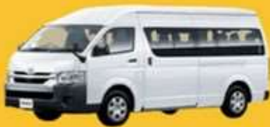
VAN (2-8 ท่าน)