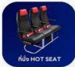
ที่นั่ง HOT SEAT