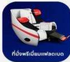
ที่นั่งพรีเมียมเฟลตเบด