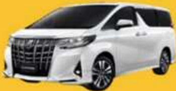
Alphard (2-4 ท่าน)