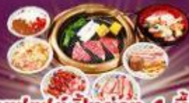
บุฟเฟต์ ปังย่าง 1 มื้อ

ราคา เดี่ยว 45,919 บาท รวมภาษีมูลค่าเพิ่ม 7%