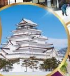
ปราสาท สึรุกะ