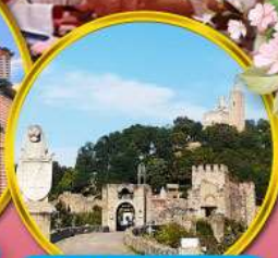
ป้อมชาเรเวทส์