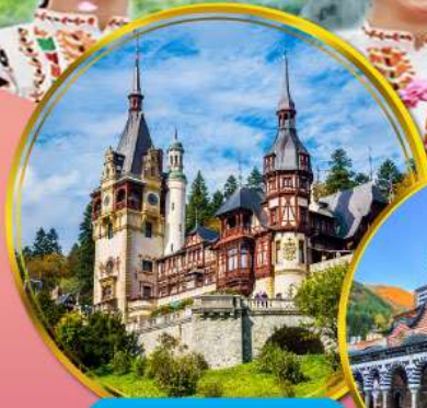
ปราสาทเปเลส