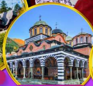
อารามมรดกโลกริลา