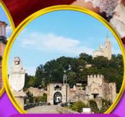
ป้อมชาเรเวทส์