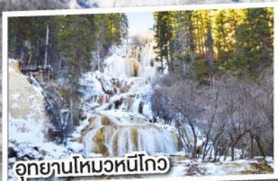
อุทยานโหมวหนี่โกว