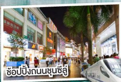
ช้อปปิ้งถนนชุนชี่