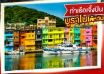
ทำเรือเจ็ปปิน บุนาโนใต้หวัน