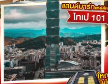
แลนด์มาร์กแห่งไต้หวัน ไทเป 101