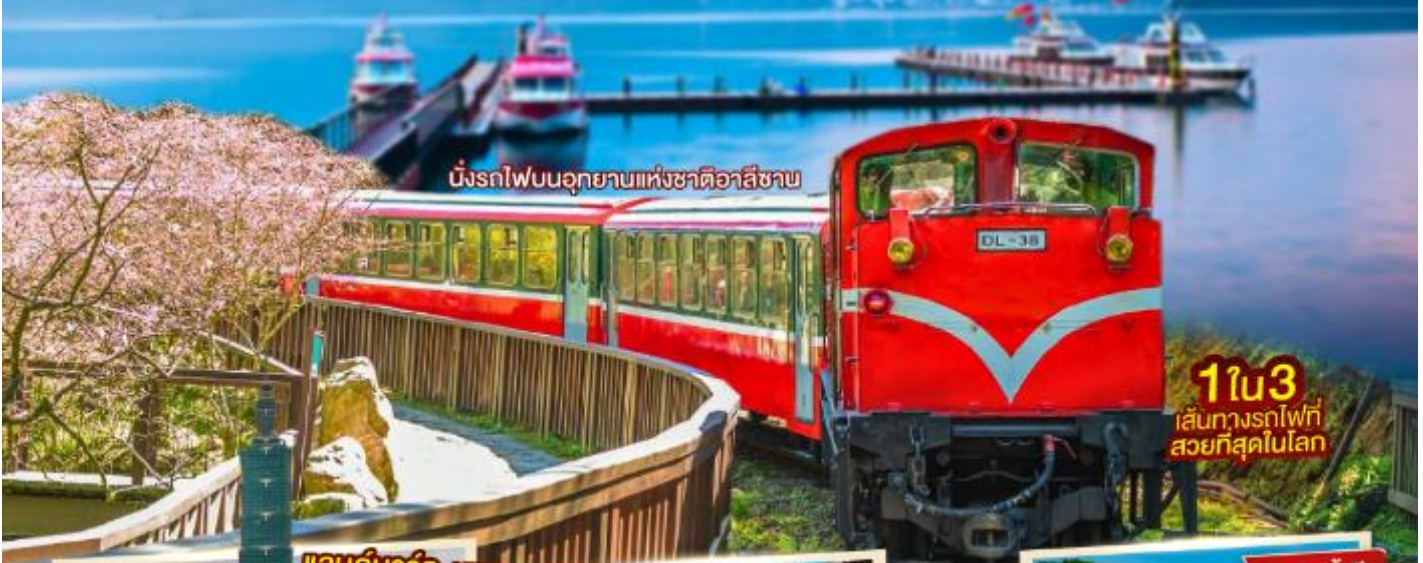
นั่งรถไฟบนอุทยานแห่งชาติอาลีซาน

ประกันการเดินทางอุบัติเหตุ คุ้มครองสูงสุด 3,000,000