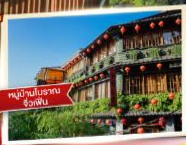
หมู่บ้านโบราณ จื่อกัฟิ่น