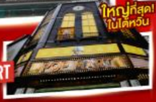
ใหญ่ที่สุด! ไต้หวัน