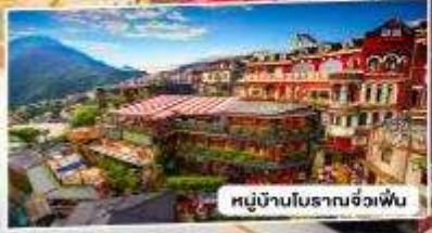
หมู่บ้านโบราณจั๋วเฟิ่น