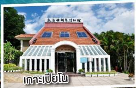
เกาะเปียโน