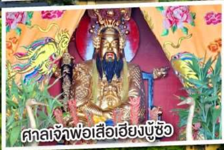
ศาลเจ้าพ่อสื่อฮียงบู๊ซ้อ