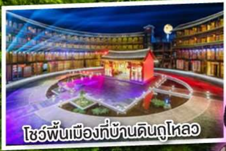
โชว์พื้นเมืองที่บ้านดินถูไหลอ