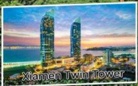
Xiamen Twin Tower