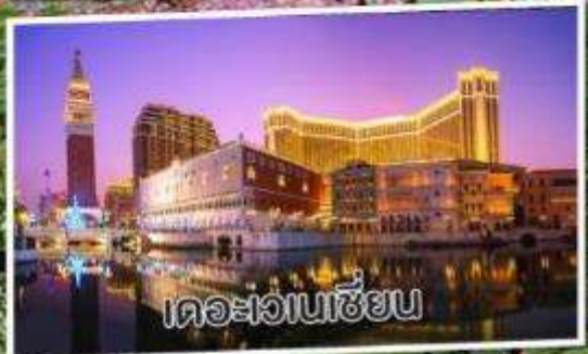
เดอะเวเนเซียน