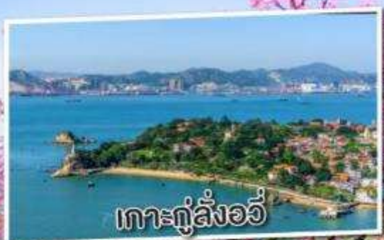
เกาะกู่ลิ่งอวี่