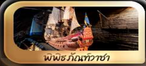
พิพิธภัณฑ์ทัวซ่า