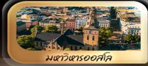
มหาวิหารออสโล